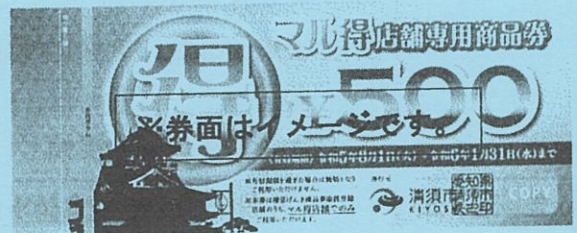
<マル得店舗専用商品券(マル得店舗限定) 500円×2枚>