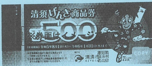
<げんき商品券(全店利用可) 6,500円(500円×13枚)×2冊>