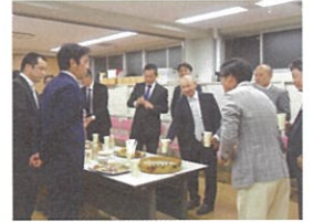
令和5年度通常総代会及び懇親会にて